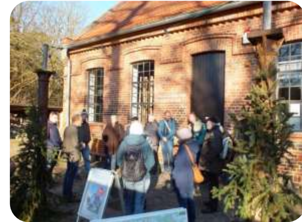
Szkolenie przewodników Geoparku w byłej hucie szkła w Baruth/Mark