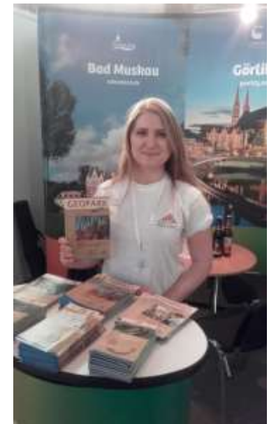
Międzynarodowe Targi Turystyki i czasu wolnego, Wrocław