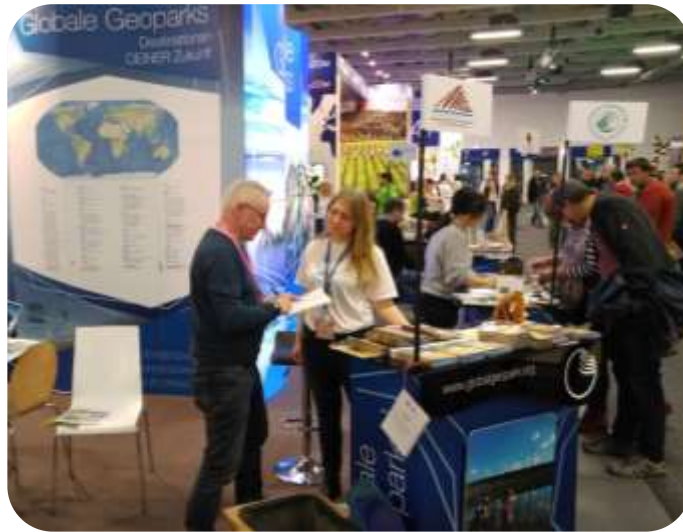
Międzynarodowe Targi Turystyczne – ITB Berlin