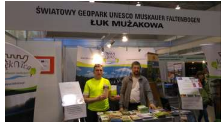
TOUR SALON, Poznań