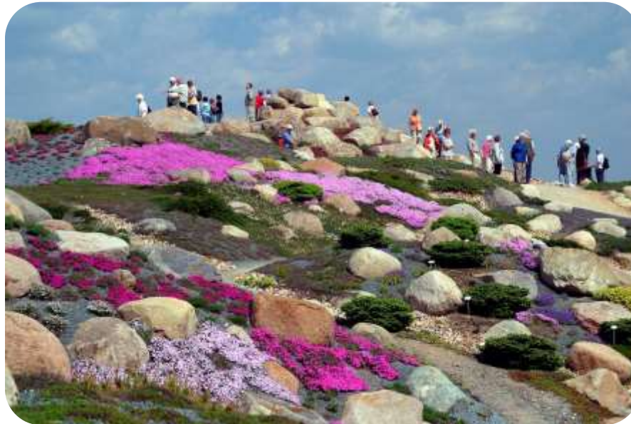
Partner Geoparku – Łużycki Park Głazów Narzutowych w Nochten